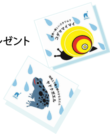
雨の日限定のオリジナルシール

期間中の雨の日限定で、カエルやカタツムリなど梅雨にちなんだ生きものたちがエントランスで来館者をお出迎えします。中には、地球上で最も鮮やかなカエルと呼ばれているヤドクガエルの仲間、全身ブルーの「コバルトヤドクガエル」も登場します。またキュレーターが“カエルが鳴いたら雨が降る”などの言い伝えや、雨と生きものとの関係を解説し、雨の日限定のオリジナルシールを来館者にプレゼントします。