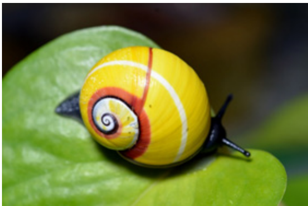
世界一美しいカタツムリ「コダマイマイ」

大阪府吹田市「EXPOCITY」の生きているミュージアム「NIFREL(ニフレル)」では、間近に迫った梅雨にちなみ、「雨にふれる」をテーマに、色鮮やかな“雨の日な生きものたち”を、2017年6月1日(木)から7月2日(日)の期間限定で展示します。どんよりしがちな雨のシーズンに、カラフルな生きものたちから元気を分けていただきたいと考えています。