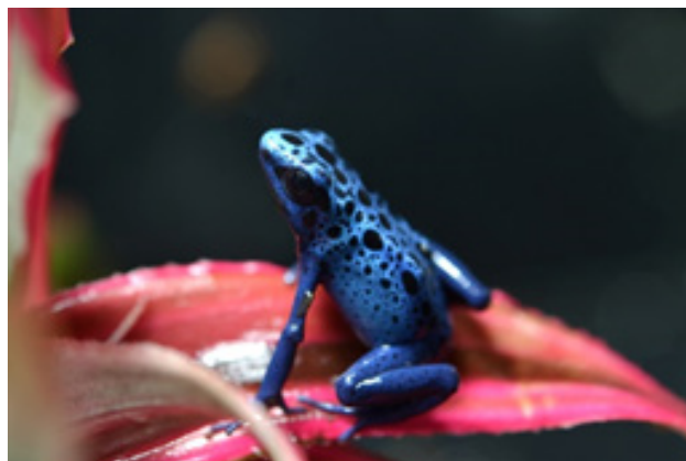
地球上で最も鮮やかなカエル「ヤドクガエル」の1種 「コバルトヤドクガエル」