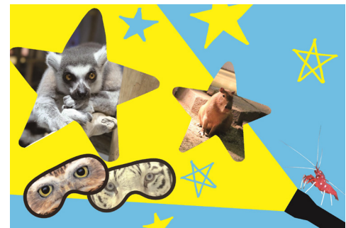
ナイトツアーイメージ