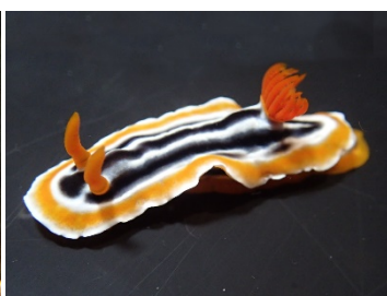
シライトウミウシ