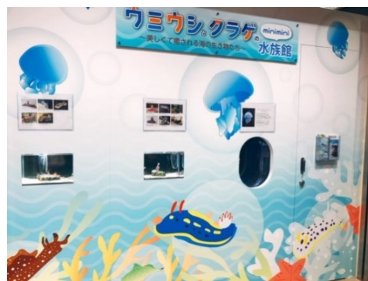
ウミウシとクラゲの minimini 水族館（昨年の様子）

「ウミウシとクラゲの minimini 水族館」では、色彩鮮やかなウミウシと、光をキラキラ反射させるクラゲを3基の水槽で展示し、海の生き物の不思議さとそれらを育む自然環境の大切さもお伝えできればと考えています。