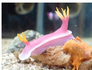
シンデレラウミウシ