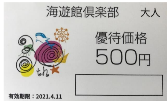
②「30周年記念 海遊館倶楽部」デザイン