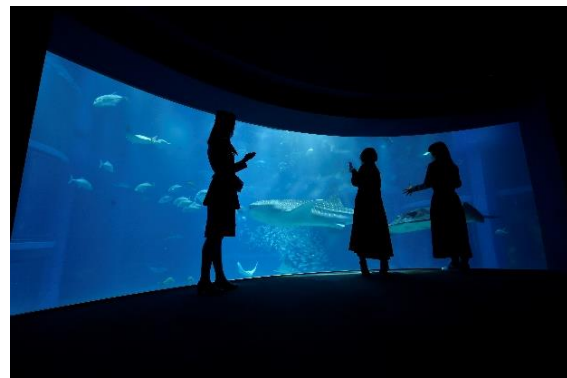
④ミニガイドを実施する「特別観覧スペース」

今回販売する商品は、ご来館いただくお客様のスタイルに合わせて、お選びいただける期間限定の新商品です。大人用の「平日限定パス」と大人用の「30周年記念 海遊館倶楽部」は、購入特典として同伴者3名様まで海遊館の入館料が25%割引になり、リピーターのお客様はもちろん、ご家族やカップルなど、幅広いお客様にご利用いただきやすい商品です。「特別観覧(バックヤード)付き入館チケット」と「ミニガイド付き鑑賞チケット」は普段、一般のお客様には解放していないエリアへ入ることができ、普段と異なる環境で、特別な鑑賞体験をご希望されるお客様におすすめです。