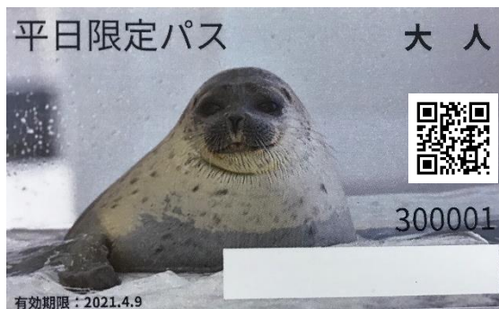
①「平日限定パス」デザイン

海遊館(大阪市港区)では、2020年10月30日(金)から「平日限定パス」と「30周年記念 海遊館倶楽部」、11月7日(土)から「特別観覧(バックヤード)付き入館チケット」と「ミニガイド付き鑑賞チケット」を順次販売いたします。