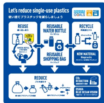
新たに展示するパネル（イメージ）