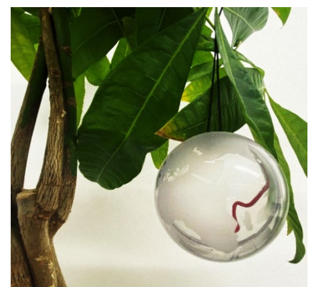
オーナメント等に再利用できる地球型カプセル