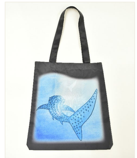
オリジナルエコバッグ

尚、今後の取組みとして、コーナー「未来の地球環境のためにできること」の展示の一部を「資源循環型社会」や「3R（リデュース、リユース、リサイクル）」について考える機会を創出する内容に変更するほか、段ボールクラフトでジンベエザメを作り、ジンベエザメの体の仕組みや海洋プラスチックゴミの影響などを解説するオンラインのプログラム「海遊館ラボ」の開催を予定しています。