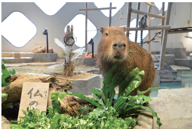
2020年1月に開催した「春の七草エンリッチメント」の様子

大阪府吹田市「EXPOCITY」の生きているミュージアム「NIFREL（ニフレル）」では、生きものたちの無病息災と健康長寿を願い、カピバラやワオキツネザルたちが暮らす「うごきにふれる」ゾーンにて、2020年12月28日（月）から2021年1月7日（木）まで「門松エンリッチメント」を、1月7日（木）から11日（月・祝）まで「春の七草エンリッチメント」を開催します。なお、本イベントは、エサの種類や与え方を工夫することで、生活に刺激を与え、行動のバリエーションを増やすことで健康管理に役立てる「環境エンリッチメント」の一環として開催します。