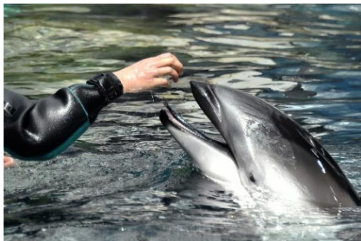
実際のトレーニングの様子