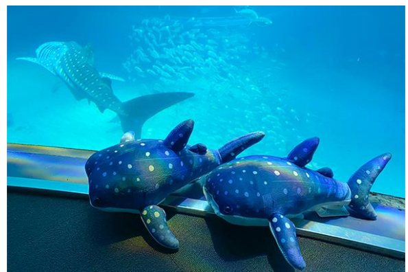
「ぬいぐるみ ジンベエザメ (オス・メス)」