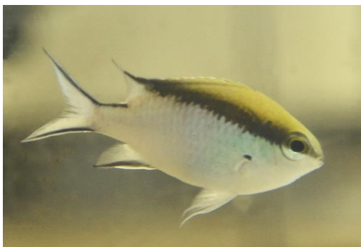
スズメダイ属の一種 (英名:Barrier reef chromis)

今回のリニューアルにて新たに館内「グレート・バリア・リーフ」水槽の紹介を行います。そして、グレート・バリア・リーフ現地の固有種であるスズメダイ属の一種(英名:Barrier reef chromis)を展示します。