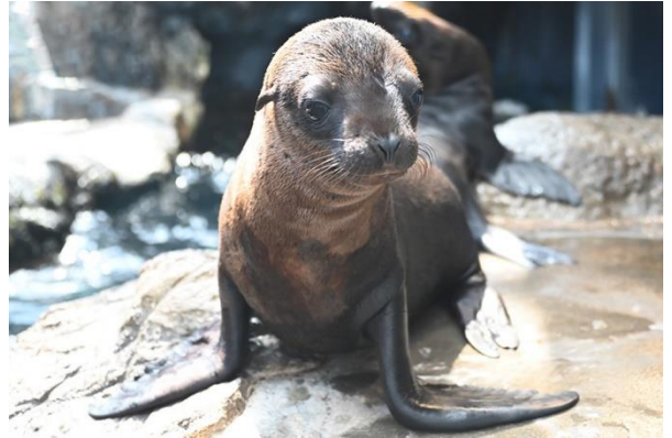
ナミ仔 (2022年7月28日撮影)