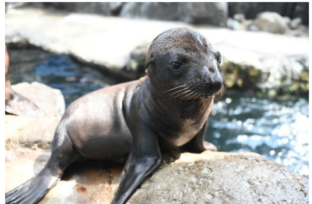
アスカ仔 (2022年7月28日撮影)