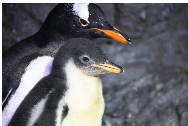
ジェンツーペンギンの親子（7月27日撮影）

6月23日に海遊館（大阪市港区）で4年ぶりに誕生したジェンツーペンギンの雛（7月4日報道発表済み）は現在、「南極大陸」水槽にてすくすく成長中です。