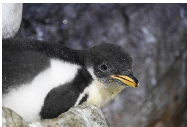
ジェンツーペンギンの雛（7月27日撮影）

親鳥の子育ての甲斐あってすくすくと成長し、ふ化直後は85.2gだった体重も7月25日には約23倍の1928gにまで成長しました。最近では親鳥の元を離れて巣の周りで過ごす様子も確認しています。