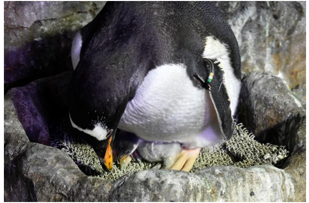
ジェンツーペンギンの親子（6月28日撮影）