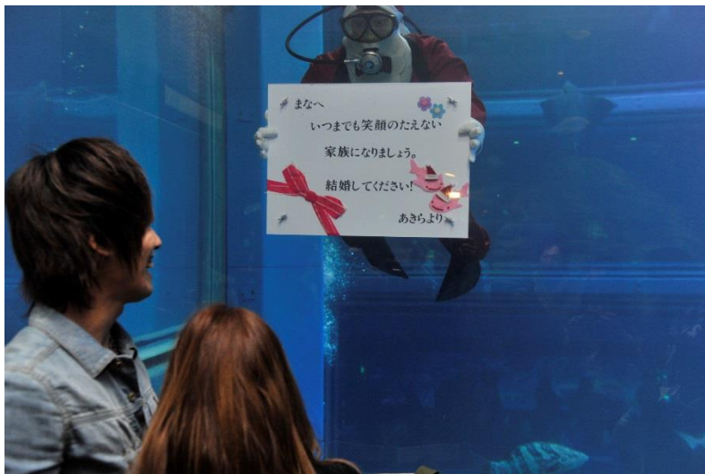
過去のアクアメッセージ参加者と、メッセージを送るダイバー

大阪市港区の海遊館では、クリスマスの期間、平成 28 年 12 月 23 日（金・祝）～12 月 25 日（日）に、各日 1 組様限定で、大切な方にメッセージを届ける『アクアメッセージ』を実施し、参加者を募集します。